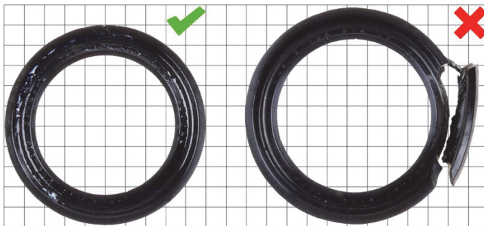
Abb. 4: Neuer Lippendichtring (1)

5 Schiebehülse (aus der Verformung gedrückt)