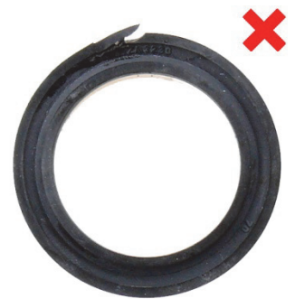
Abb. 7: Lippendichtring (1) abgeschert