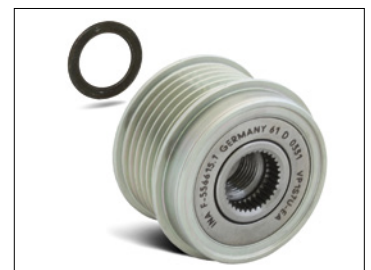
Bild 3: Beim Einbau des Generatorfreilaufes an einem Bosch Generator (Ford Transit) muß die beiliegende Distanzscheibe mit der Dicke 1,4 mm verwendet werden!

Angaben des Fahrzeugherstellers beachten!