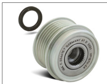
Bild 2: Beim Einbau des Generatorfreilaufes an einem Visteon Generator (Ford Mondeo III) muß die beiliegende Distanzscheibe mit der Dicke 3 mm verwendet werden!